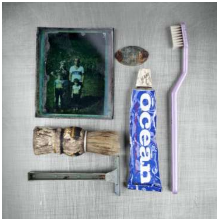
Zijah Gafić, Bez naziva, iz serije Potraga za identitetom, 2003.