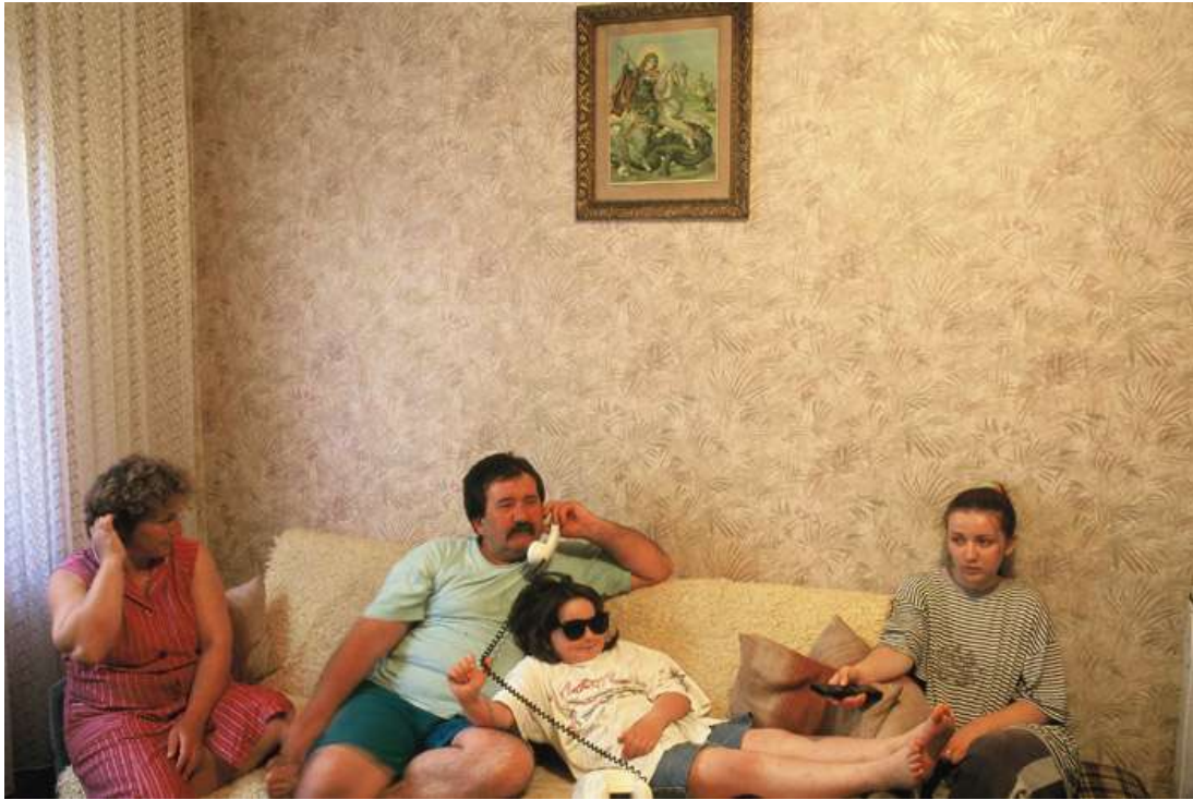
Dragan Petrović, Bez naziva, 1991.