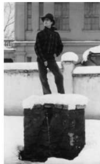
Dei leči, Spomenik, 1959.