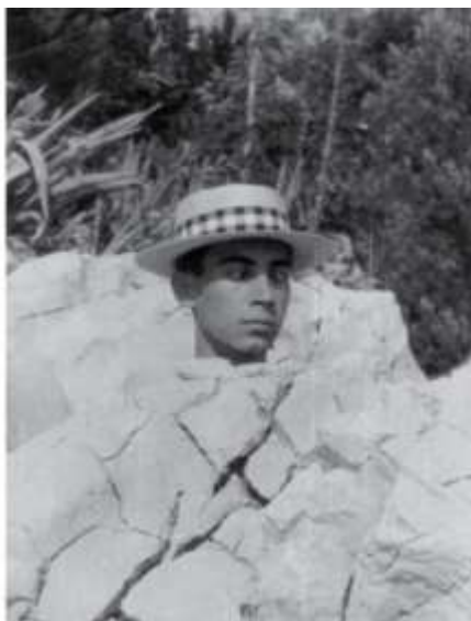
Dei leči, Ustenjen, 1965.