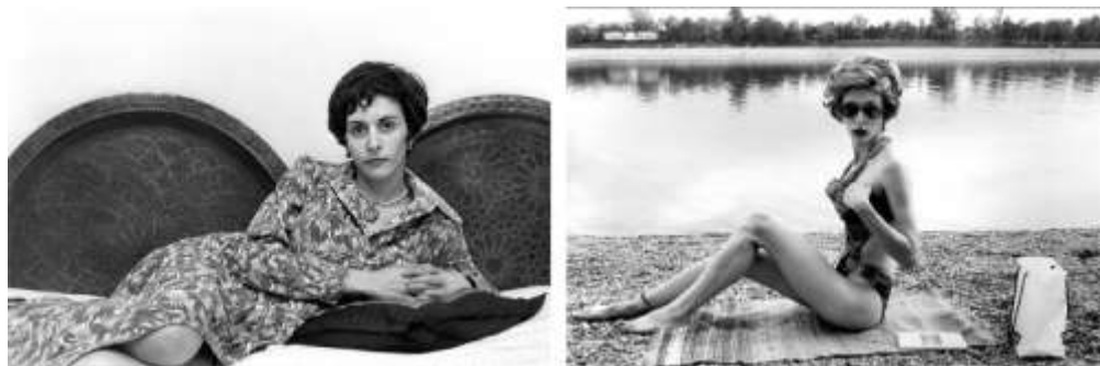
Katarina Radović, Žene , 2013.

Iako se metodologija, stav i krajnji rezultat potpuno razlikuje kod svake umetnice ponaosob – dok Katarina Radović ukazuje na ženu kao stereotipiziranu činjenicu i predstavlja svojevrsni teorijski i simulirani postupak, Tanja Ostojić predstavlja ženu u svojoj ogoljenoj pukoj fizičkoj formi, i zaista interveniše unutar društvene i političke stvarnosti pretvorivši se u sam objekt rada – obe umetnice javno i ironično izlažu fotografije sebe kao objekta požude koje potom traže i provociraju parametre i društvene norme izvođenja i konstruisanja vizuelnog i jezičkog identiteta žene - žene onakvu kakvu je (samo) muškarci vide. U tom smislu, Katarina Radović i Tanja Ostojić postaju i objekti i proizvođači diskursa koje remete Malvijeve postavku kategorije subjekt – objekt / muškarac – žena, te subvertiraju maskulinizaciju posmatrača koja se (pro)izvodi u dominantnoj kulturi.