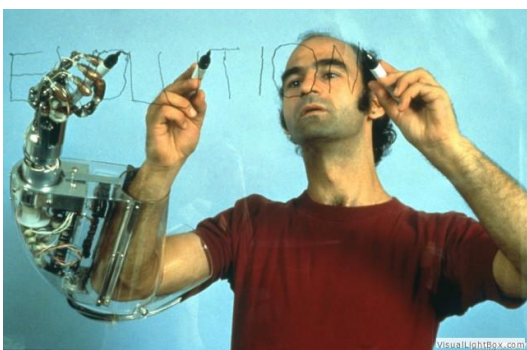
Слика 19. Аноним, „Handwriting”, http://stelarc.org/media/lightbox/data/images/9.jpg , приступљено: 10. мај 2023.