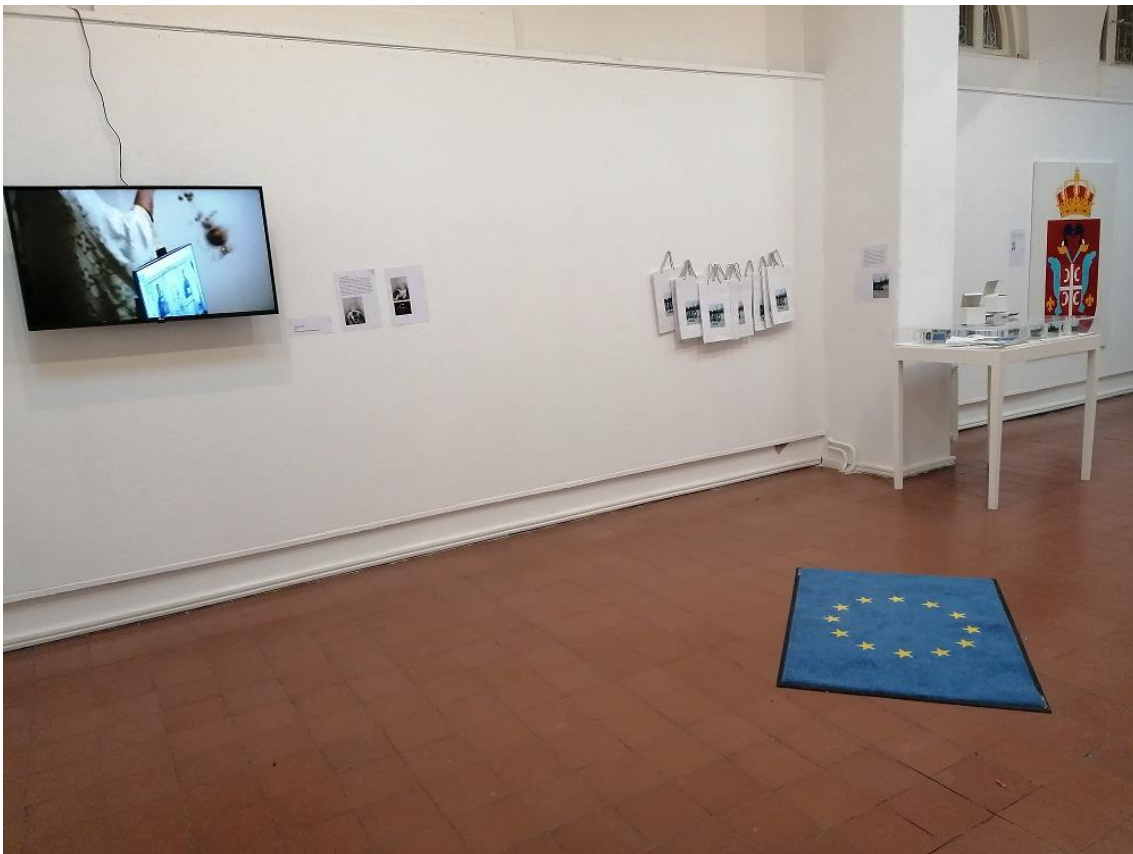
Слика 3. Кристина Јањић: амбијентална инсталација Ода радости , фотографија са изложбе, 2022.