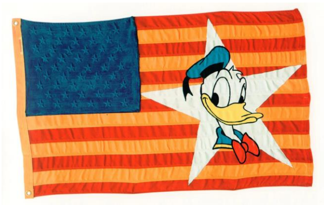
Слика 12. Ronnie Cutrone: "Duck Star," digital image, Lorenzelli Arte, 2005, accessed 04.04.2023. https://lorenzelliarte.com/en/artists/43-ronnie-cutrone/works .

У Кутроновом случају може се говорити о фузији естетског и моралног ексцеса, међутим у сржи његове серије радова са ликовима из цртаних филмова није свесно изазивање провокације друштва нити апсурд, иако истиче да је временом био почео прихватати контроверзе као део свог рада.