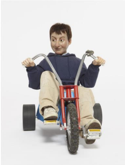
Слика 18. Аноним, „Маурицио Кателан, Чарли”, https://www.phillips.com/detail/maurizio-cattelan/NY010710/6 , приступљено: 10. мај 2023.

Насупрот приступима који се заснивају на интеракцији између машине и људског бића или проблематизовању односа између друштва и технологије, италијански уметник Маурицио Кателан (Maurizio Cattelan) направио је 2003. године „Чарлија” (Charlie), кинетичку скулптуру на даљинско управљање за педесето Венецијанско бијенале. У овом случају ради се о ауторефлексивној скулптури при чему уметник користи антропоморфну лутку-робота, односно сопствени портрет за описивање прикривених страхова и траума.