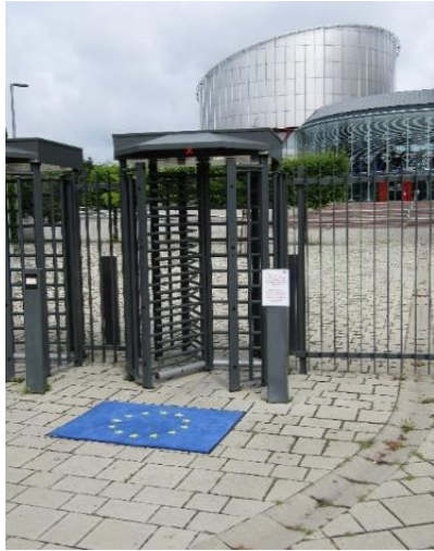
Слика 1. Кристина Јањић: Отирач испред Европског суда за људска права у Стразбуру, фотографија, 2021.