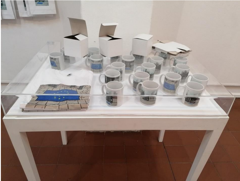
Слика 2. Кристина Јањић: амбијентална инсталација Ода радости , фотографија са изложбе, 2022.