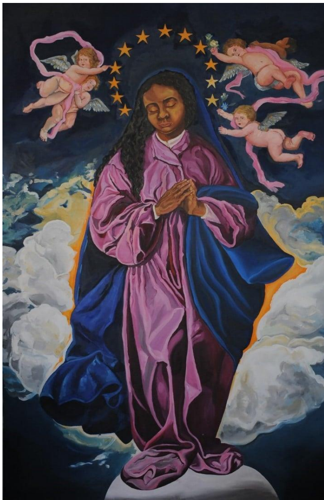
Слика 6. Кристина Јањић: Слика Безгрешно зачеће , уље на платну, 2021.

Слику „Безгрешно зачеће” насликала сам техником уље на платну. На слици је