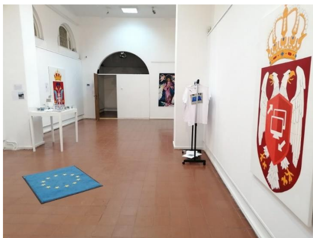
Слика 10. Кристина Јањић: Слика My Country is Beyond Trust , уље на платну, 2022.