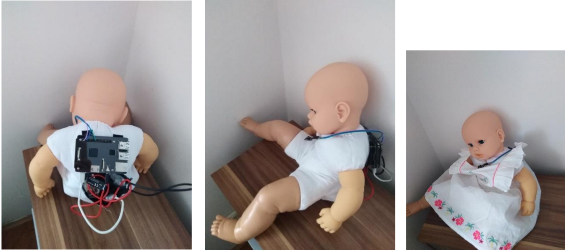
Слика 15. Кристина Јањић: Лутка са уређајем Raspberry PI3