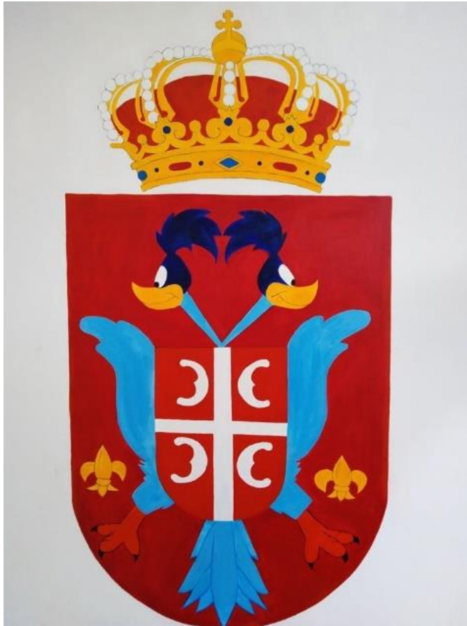
Слика 9. Кристина Јањић: Слика Птица тркачица , акрил на платну, 2019.

установљену уметност и политичке институције, упркос космополитском интересу да учествују у интернационалном напору естетске и друштвене револуције, европске авангардне уметничке групе су посебно биле мотивисане да уздигну престиж сопствене нације 84 .